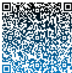
QR Code programme